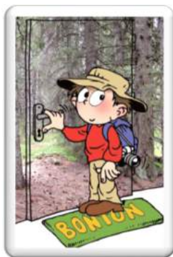
Ilustracija: Samo Jenčič